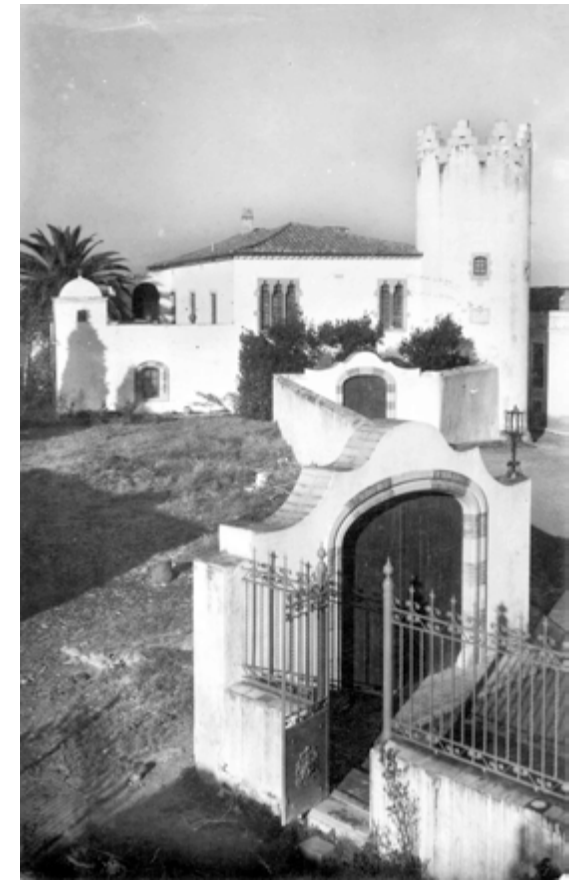
La torre de can Pella i Forgas. Comercial Prat.

D'altra banda, l'Ateneu Barcelonès, amb motiu de la mort del seu soci i antic president va dedicar-li aquest homenatge: «era un patrici eminent: model d'alta y noble laboriositat, escriptor pulquèrrim, historiador y jurista sapientíssim y, per tant, verdadera glòria de la nostra pàtria, que li és deudora de tantes y tan preuades obres mercès a les quals Catalunya ha pogut adquirir nova consciència de sí mateixa y avençar ardidament pel camí de les seves rehabilitacions històriques y jurídiques.» 12