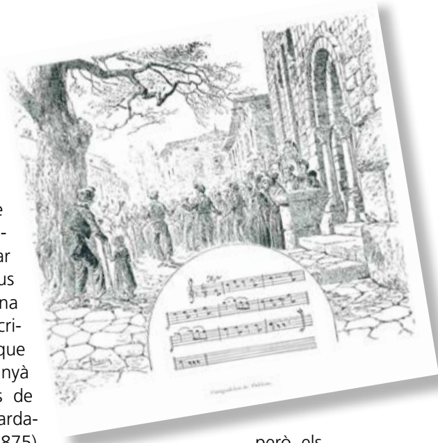
Il·lustració del capítol sobre la sardana a la «Historia del Ampurdán», edició facsimil de 1980, p. 45. AMP.

Es tracta del poema que comença amb els famosos versos: «La sardana és la dansa més bella / de totes les danses que es fan i es desfan». Més endavant en el poema ja dona per descomptat que és el ball nacional de Catalunya, amb la qual cosa es fa palès que l'afirmació que Pella i Forgas havia apuntat el 1883 a la seva Historia del Ampurdán és ja una realitat. Així doncs no és gens arriscat considerar-lo un pioner en aquest aspecte.