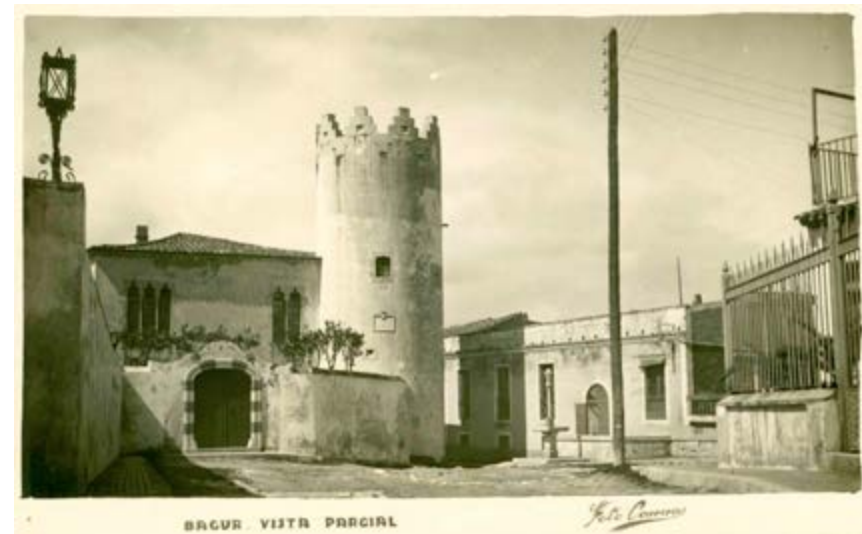
Imatge de la Torre de Can Pella i Forgas, casa natal de Josep Pella i Forgas, abans de la seva restauració, declarada Bé Cultural d'Interès Nacional.

Amb aquest quadern ens agradaria, a través dels seus escrits, els testimonis que ens parlen de la seva vida, i els treballs dels estudiosos que han fet entenedores la seva vida i la seva obra, poder definir l'home darrere el personatge. I per això creiem que és imprescindible fer unes pinzellades dels temps que li van tocar viure: al capdavant, tots som fills d'una època. A partir d'aquí anirem analitzant totes les cares d'aquest begurenc tan polièdric, sense oblidar que totes pertanyen a la mateixa persona: una gran personalitat que va deixar un important llegat per a les generacions que hem seguit.