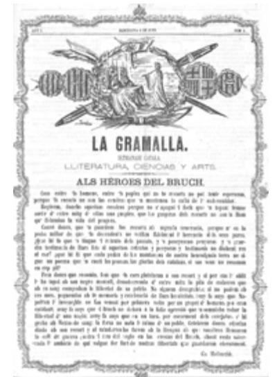
Frontis del num. 4 del 6 de juny de 1870 de «La Gramalla».

Una altra publicació on el beguerec col·laborava va ser la Revista de Gerona (1876-1895), on feia les seves aportacions juntament amb altres historiadors gironins.