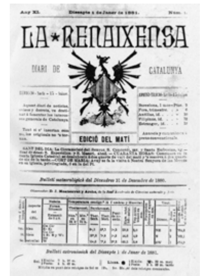
«La Renaixença», gener de 1881. Capçalera de Domènech i Montaner.