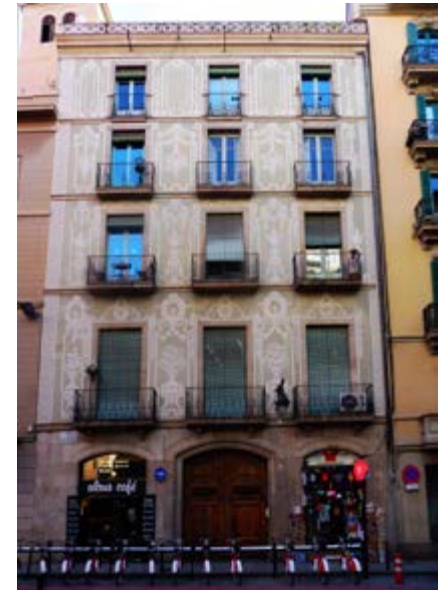
Carrer Sant Pere més Alt, número 4, on la família Pella vivia a Barcelona.