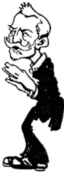
Caricatura de Pella i Forgas extreta de «L'Esquella de la Torratxa», Barcelona, 22 de setembre de 1905.