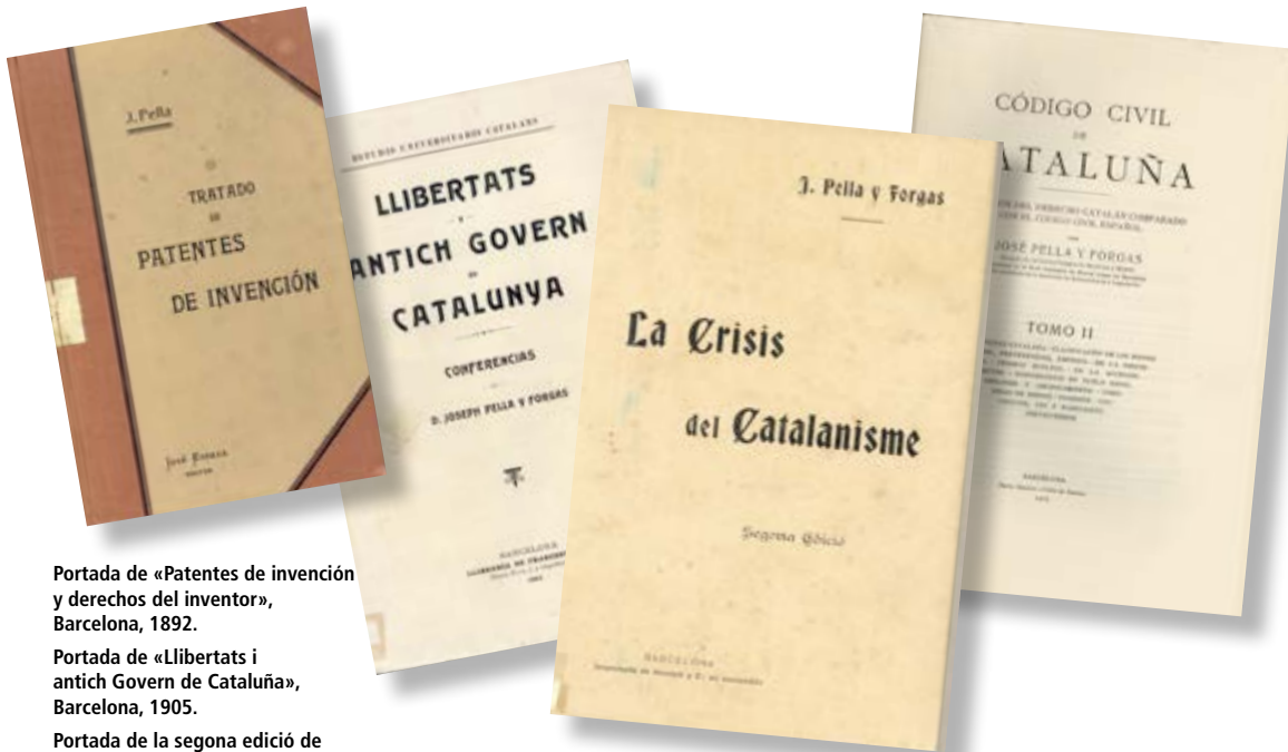
Portada de «Patentes de invención y derechos del inventor», Barcelona, 1892.

Tots els comentaristes de l'obra coincideixen a considerar-lo un pioner en la compilació del dret civil català, al qual va salvar del seu deteriorament progressiu i dels primers a marcar un camí per tal d'atorgar competències legislatives en aquesta matèria a les comunitats autònomes. De fet, la Constitució autonomista del 1978, que atorga competències per legislar en matèria civil a aquelles comunitats autònomes que tinguessin dret civil vigent en el moment de l'entrada en vigor de la Constitució, respon a aquest ideal que Pella havia esbossat el 1912 a la conferència a l'Acadèmia de Legislació i Jurisprudència amb el títol Codificación moderna y codificación catalana .