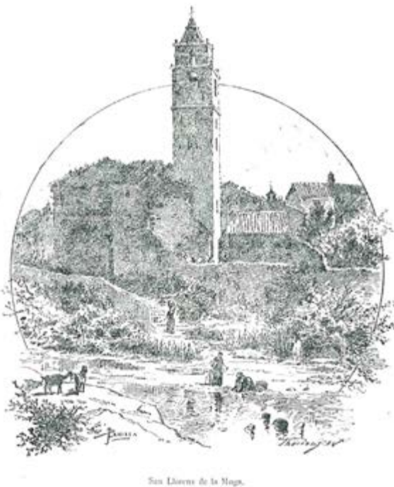
Il·lustració de l'edició facsimil de 1980 de «Historia del Ampurdán», p.577 i p. 741. AMP.

ri i etnogràfic, que no perd vigència. Des d'aquí animem el lector d'aquest llibret a llegir la Historia del Ampurdán , de ben segur hi trobarà punts d'interès.